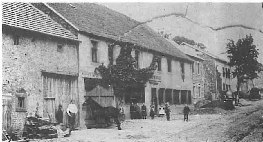
Gasthaus Leo Altmeyer, Gresaubach Wendalinusstraße.

Eine große Erleichterung brachte kurz vor der Jahrhundertwende die Fertigstellung der Eisenbahnverbindung Wemmetsweiler - Lebach. Man brauchte nur noch nach Lebach zum Bahnhof zu marschieren. Das Leben im Schlafhaus, eine ganze Woche getrennt sein von der Familie und dem Heimatort, das war nicht jedermanns Sache. So legten sich einige Bergleute ein Fahrrad zu und nahmen bei Wind und Wetter die beschwerliche und bergige Strecke von Gresaubach über den Erzeweg und das Tanneck hinunter nach Lebach in Kauf, nur um täglich zu Hause sein zu können. Fahrradabstellplatz und zugleich Stammwirtschaft der »Saubacher« Bergleute war zu dieser Zeit das Gasthaus Heinrich Schommer in Lebach in der Trierer Straße, das einen besonderen Platz zum Abstellen und Aufbewahren der Fahrräder zur Verfügung stellte.